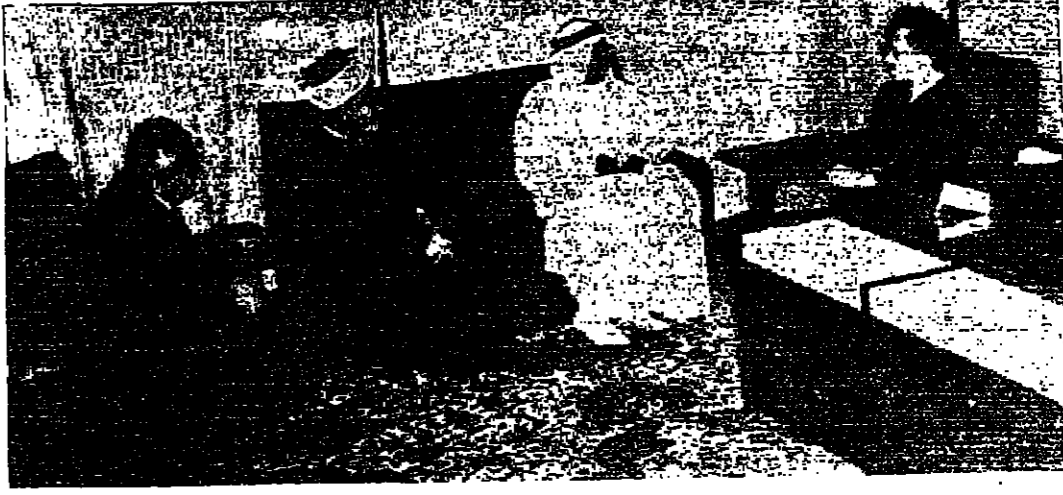
جلالة الملك المعظم يتحدث الى وفد رابطة العالم الاسلامي وسيدة المشر السوردي في عمان